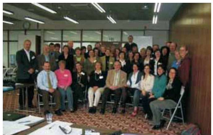
The EURO-PREVOB team and supporters

Sudionici su radili intenzivno u radnim grupama da bi prikazali skicu instrumenta za političku analizu i načinili su veoma korisnu konstruktivnu povratnu informaciju koja je naznačila sljedeći nivo projekta. Sljedeći službeni sastanak savjetodavne i naučne komisije će biti u Sarajevu, u oktobru, 2008 god