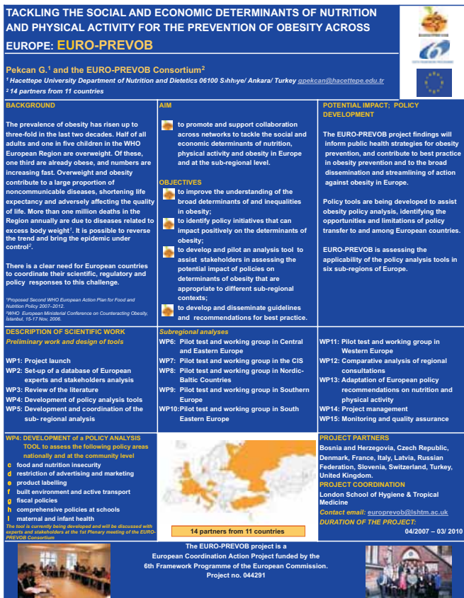
Güldenov poster na šestom Internacionalnom kongresu o ishrani i dijetetici, april, 2008