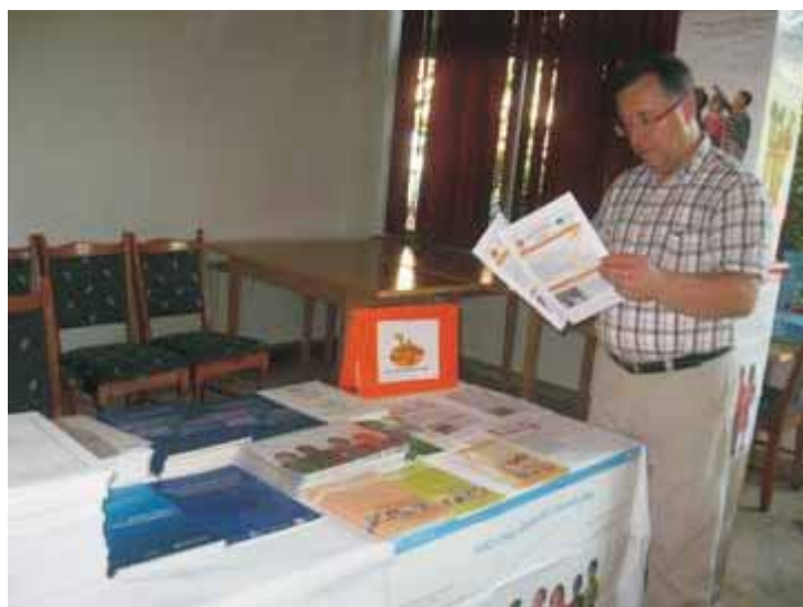
Kolega čita EURO-PREVOB materijale na Petim danima socijalne medicine/javnog zdravstva, Mostar

Preko 70 sudionika, u glavnom stručnjaka na području javnog zdravstva, zdravlja okoliša i klinički eksperti iz Bosne i Hercegovine i Crne Gore bili su prisutni.